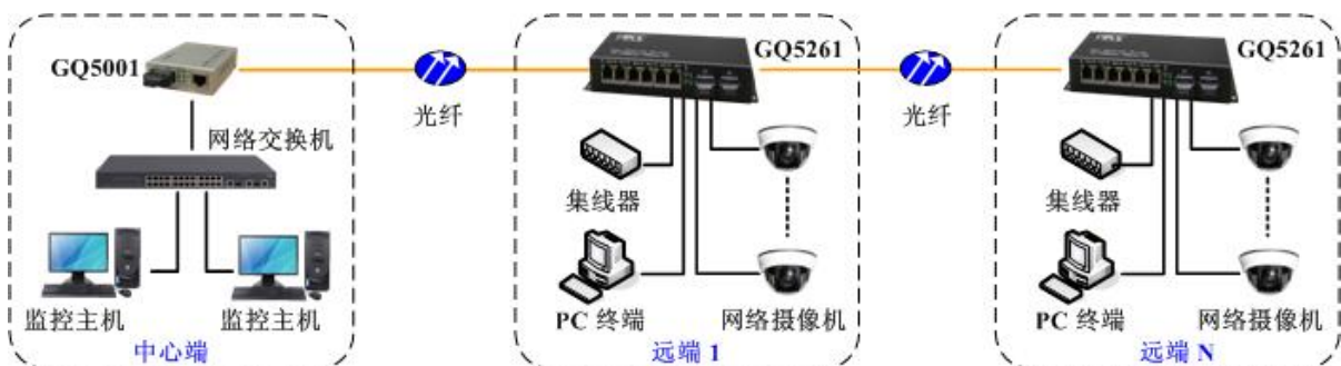
方案一：光纤多点组链型网络